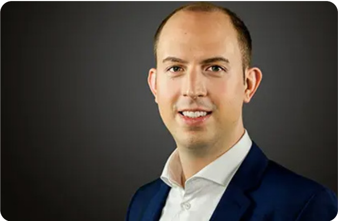
Name Last name – Describe skills or position

CC Library valantic B – A4 Print: Placeholder • Image