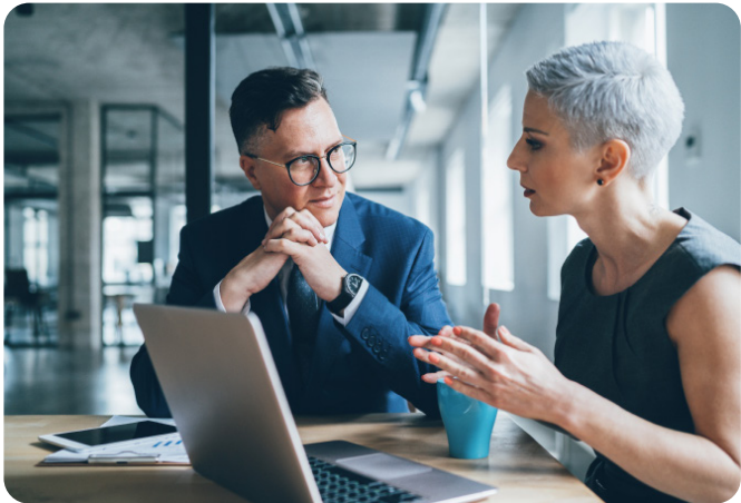
Strategieausarbeitung Cloud Software

TEXT: MAX MUSTERMANN